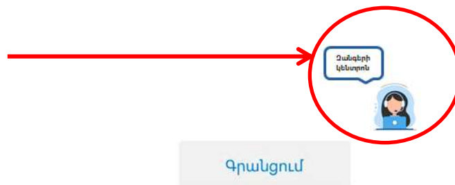
Նկ. 4. Կեղծված տարբերակ, որում ավելորդ պատկերներ կան