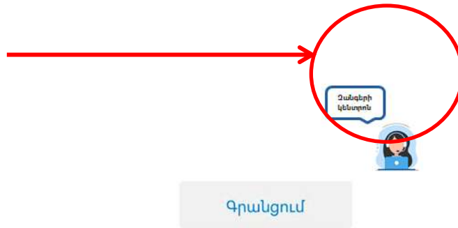
Նկ. 4. Կեղծված տարբերակ, որում ավելորդ պատկերներ կան